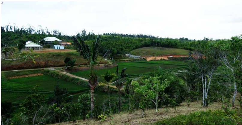
En haut à droite le premier mur en construction du futur potager

Constructeur, je le reste car il reste à construire, cette année, le pôle mère-enfant, le jardin potager en terrasse (nous y travaillons actuellement) pour faire nos propres légumes (de + en + chers) pendant l'hiver austral (avril à septembre). Alors, constructeur ? Directeur ? De fait, les deux ! Avec la nouvelle fonction d'agent social où il me faut rencontrer les personnes afin de savoir si elles sont vraiment indigentes, qu'elles n'ont vraiment personne pour prendre une part active dans les travaux divers sur le site de l'hôpital, dans les rizières, (l'hôpital a besoin de près 8 tonnes de riz blanc