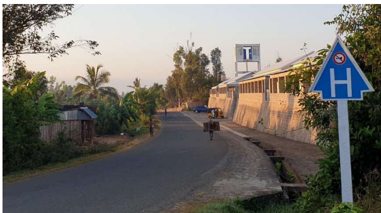
HSA vu de la RN 25, au lever du jour.